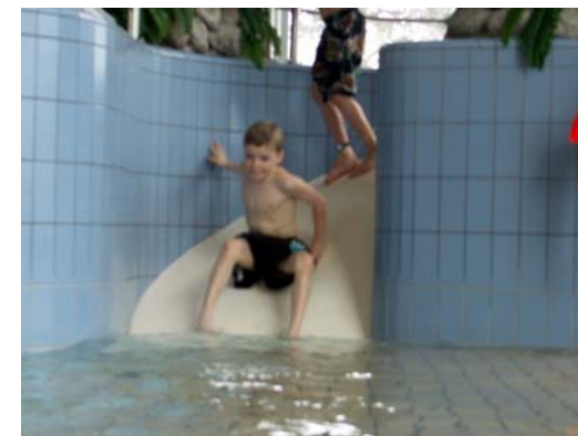
Miniruschelkana i vågbassängen

Nästan i strandlinjen av vågbassängen och helt nära barnpoolen finns denna lilla miniruschelkana för de minsta. Vattendjupet vid ”landning” är bara någon decimeter.