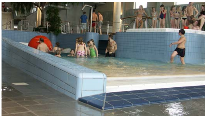
Vågbassängen med sin badstrand