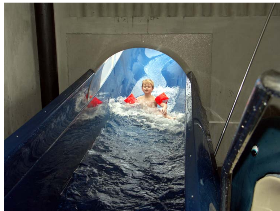
Inget större vågsvall vid landningen