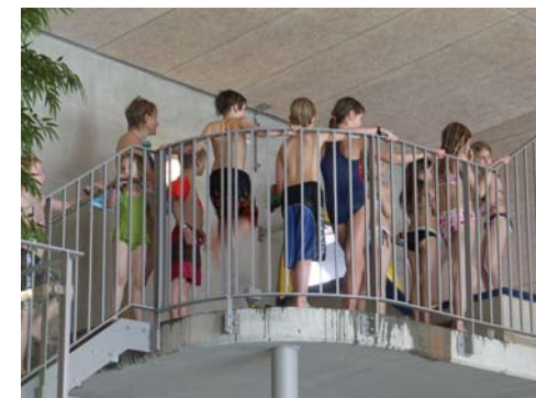
Startplatsen för ruschelkanan

Två högervarv och ett till vänster. Sedan är du nere i bromsrännan. Mycket beskedlig fart.