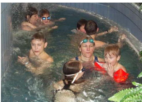
Drag i kanalen

Sveriges minsta pist? Bara några få meter lång och med vatten i bassängen som i stort sett bara knädjupt. Men kul i alla fall.