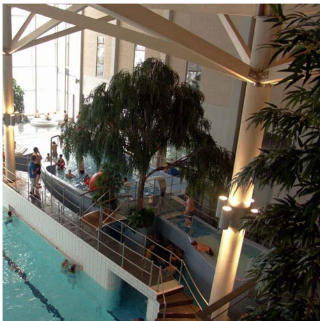
Bakom trädet gömmer sig en vågbassäng.

I strandkanten finns bubbel. Likaså bubblar det i kanalen som leder från vågbassängen till strömkökanalen.